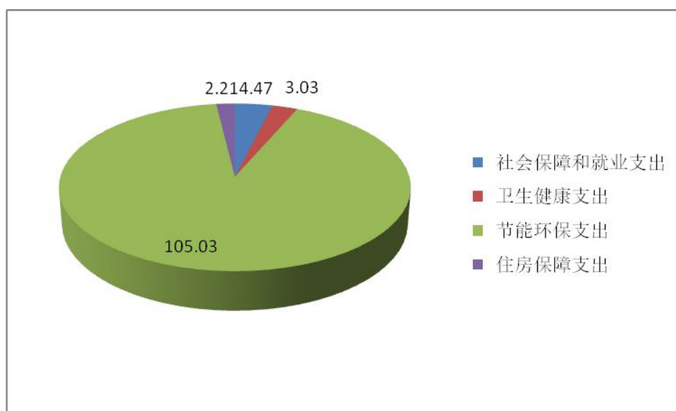
2020 年财政拨款支出预算情况

海东市生态建设办公室 2020 年财政拨款收支总预算 114.74 万元，比 2019 年增加 1.2 万元，主要是：事业工作人员增加 1 名；2019 年未实施完的项目，2020 年继续实施。收入包括：一般公共预算拨款 47.53 万元，政府性基金预算拨款 0 万元，上年一般公共预算拨款结转 67.21 万元；支出包括：社会保障和就业支出 4.47 万元，卫生健康支出 3.03 万元，节能环保支出 105.03 万元，住房保障支出 2.21 万元。