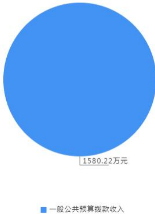
2024年收入预算构成图