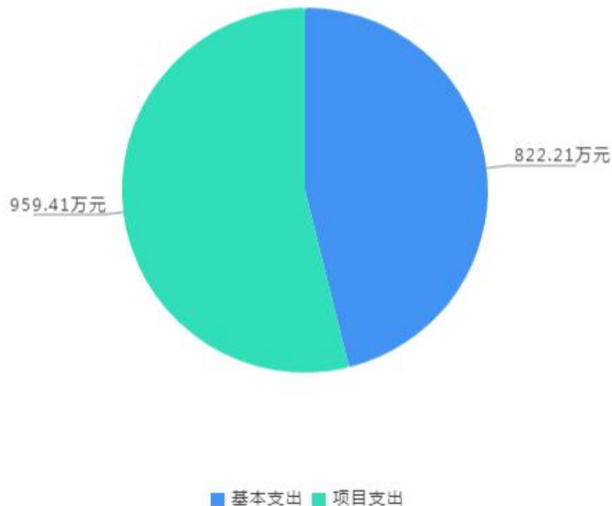
2023年支出预算构成图