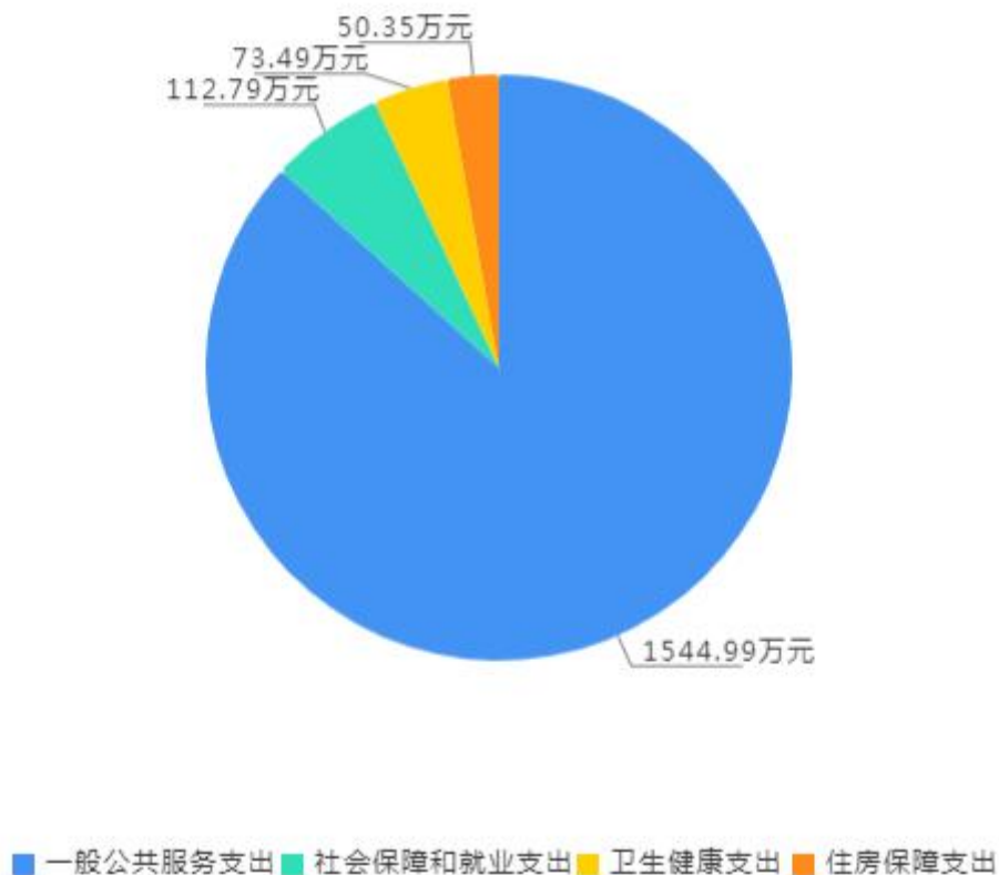
2023年财政拨款预算支出