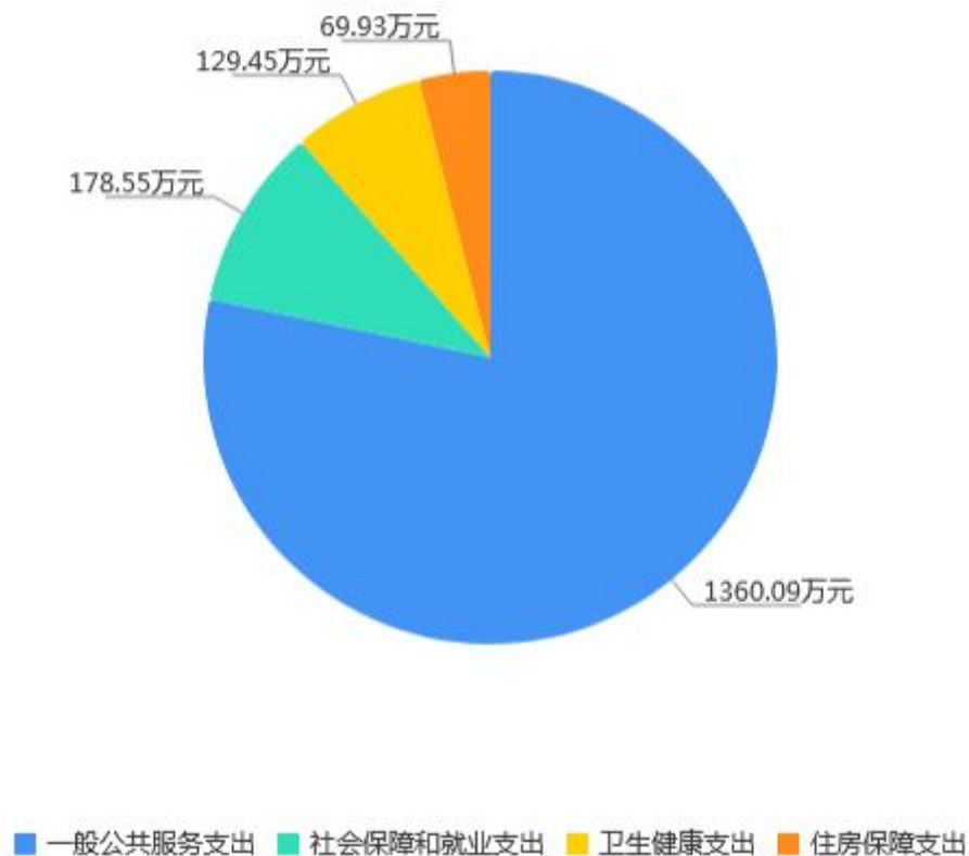
2023年财政拨款预算支出构成