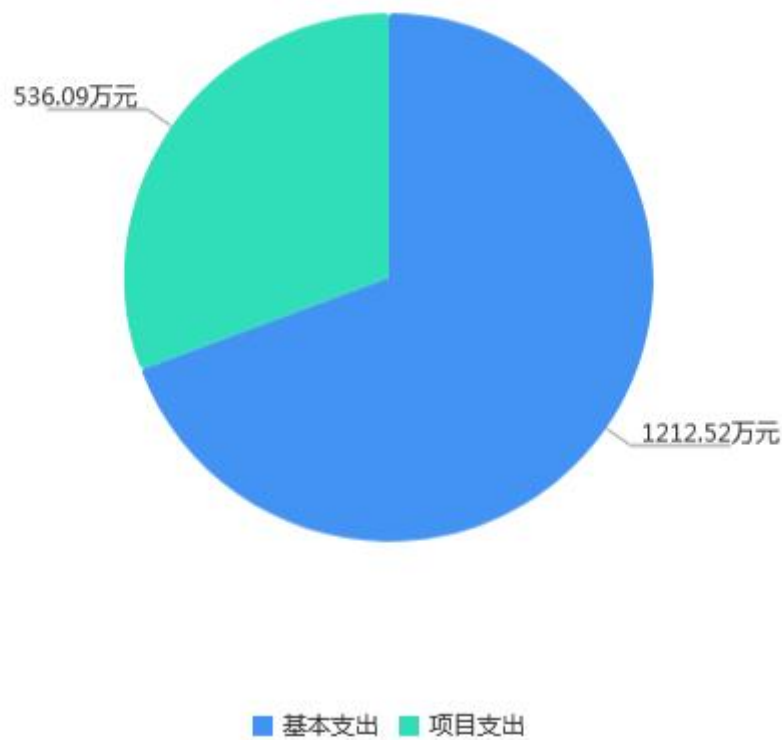
2023年支出预算构成图